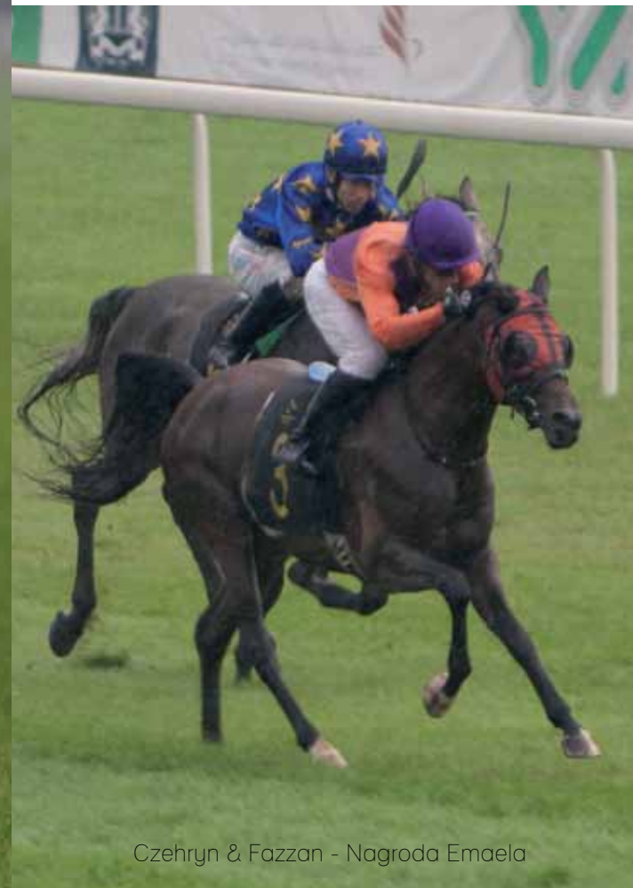
Czehryn & Fazzan - Nagroda Emaela