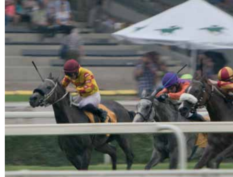
Course 4 : Nagroda Sabelliny (cat. B)

tant, le n°4 Chaco, issu du haras d'état de Michalow dont la mère n'est autre que la fille du célèbre étalon de tête polonais de ce haras, Emigrant (Ararat et Emigrantka par Eukaliptus) multiple champion en show. A noter également le n°6 Fazzan, un fils de Shanghai EA vice-champion du monde de show également. Le n°2 Winaria, compte également par sa mère Windawa un autre grand reproducteur et champion du monde de show Gazal Al Shaqab. Les lignées de la plupart des chevaux que nous avons vus courir sont cependant plus classiques. Lorsque l'on regarde le nom de leurs pères on retrouve le meilleur des lignées françaises avec des étalons comme Nougatin (Dormane x Nouillaugratin par Dunixi) et Marwan I (Manganate x Marifa par Chéri Bibi) et des lignées polonaises avec Ontario HF (Monarch x HF Orzonna par Pepton). Il semble cependant que les grands étalons des haras nationaux polonais aient produit avec succès aussi bien en show qu'en course à l'image d'Etogram descendant d'Ofir (1933) ou d'Emigrant de la lignée de Negatiw, prouvant que ces disciplines peuvent se rencontrer avec succès. ■